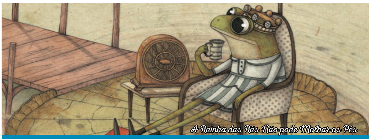
A Rainha das Rãs Não pode Molhar os Pés